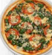
Classic ø 31 cm