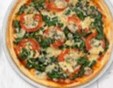
Jumbo ø 36 cm