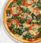
Jumbo ø 36 cm